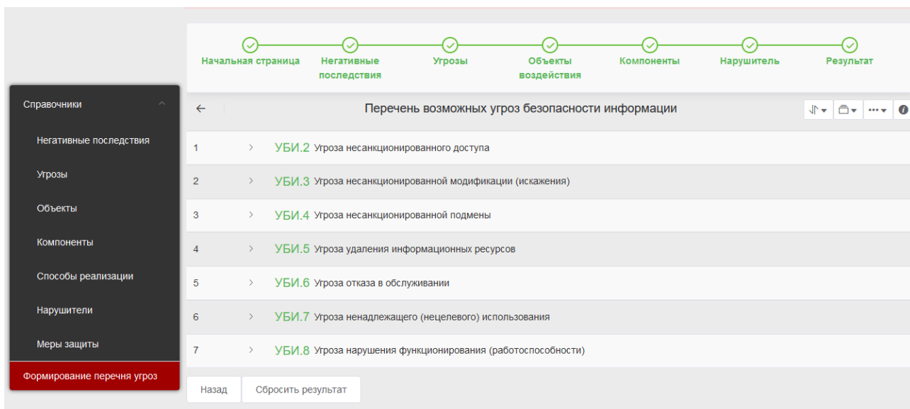
Рис. 3. Результат моделирования угроз

Вводя поэтапно актуальные данные исследуемой информационной системы, формируется модель угроз безопасности информации (рисунок 3).